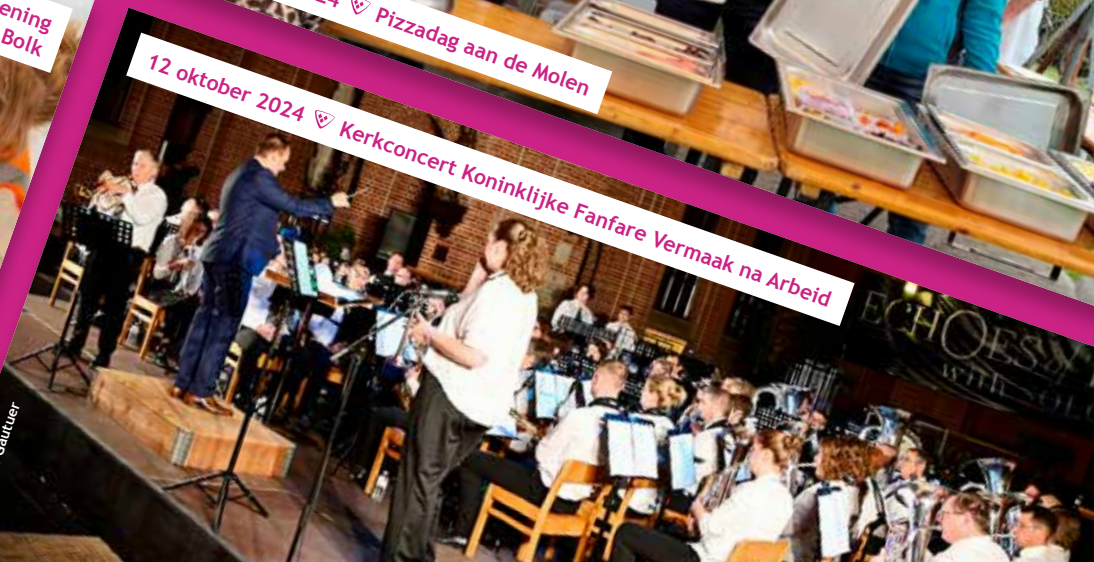
12 oktober 2024 📍 Kerkconcert Koninklijke Fanfare Vermaak na Arbeid