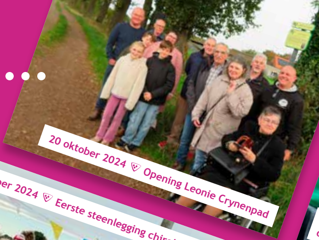
20 oktober 2024 📍 Opening Leonie Crynenpad