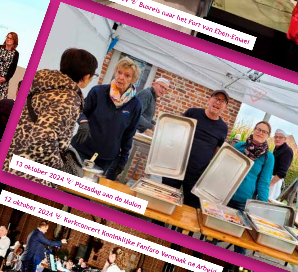
13 oktober 2024 📍 Pizzadag aan de Molen