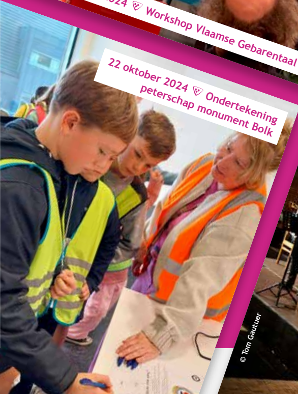
22 oktober 2024 📍 Ondertekening peterschap monument Bolk