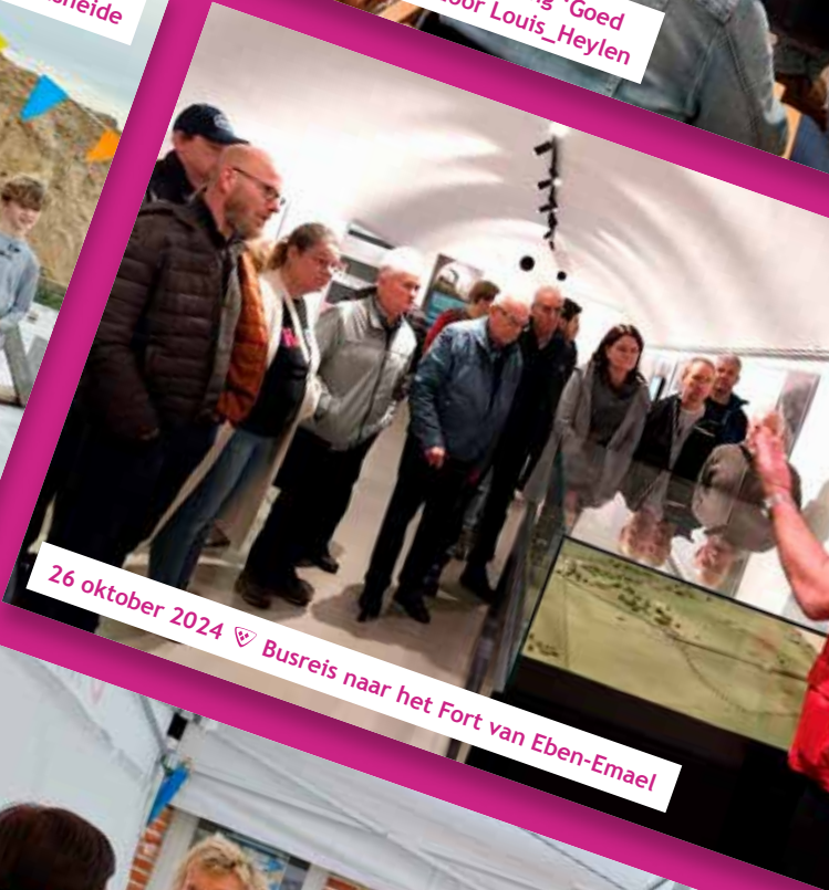
26 oktober 2024 📍 Busreis naar het Fort van Eben-Emael