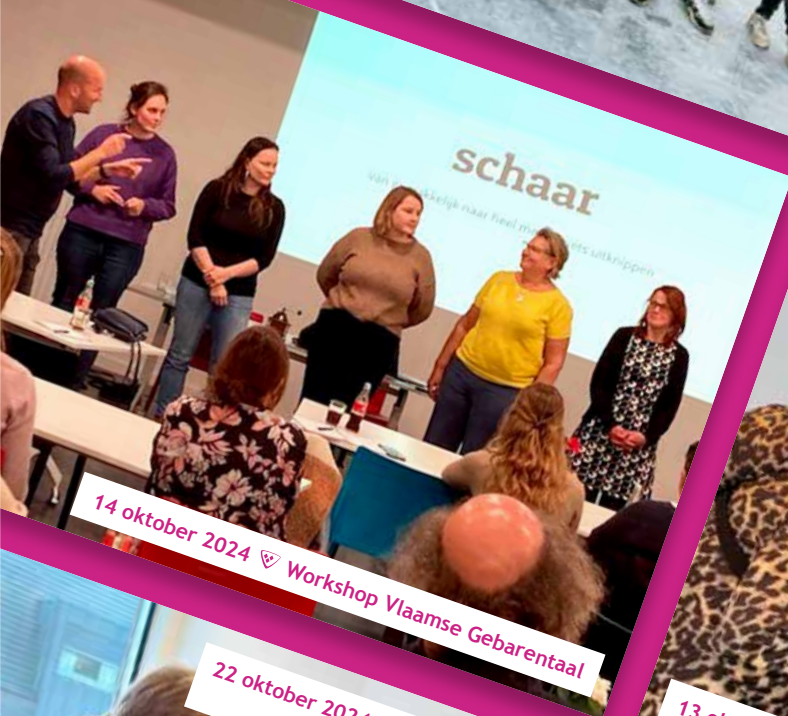
14 oktober 2024 📍 Workshop Vlaamse Gebarentaal