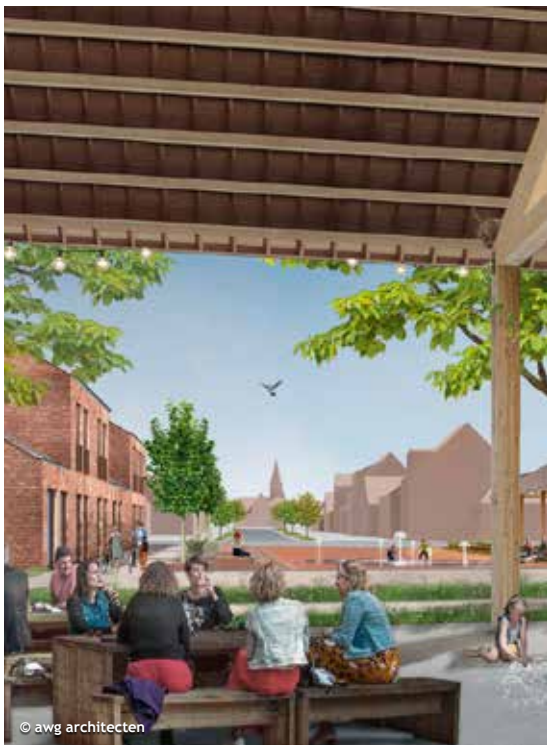
2. Zicht vanuit het hart van de site achter de voorgevel op het verdiepte waterplein richting de kerk.

Proland, awg architecten en Vanhout.pro, een dochterbedrijf van Groep Van Roey, zullen instaan voor de ontwikkeling van de woonzones langsheen Stevennekens en Hoge-Heideweg. Deze zones worden centraal gescheiden door een strook met erfgoedelementen: de gevel van het voormalig ovengebouw, het ovenfragment en de arcadebogen. Die strook zal de gemeente in nauw overleg met de projectontwikkelaar aanleggen als groene buffer tussen de woongebieden met een prominente plaats voor het industrieel erfgoed. Ruimtelijk vindt deze centrale strook ook aansluiting met een plein langsheen de straat Sint-Jozef, dat ook door de projectontwikkelaar wordt aangelegd.