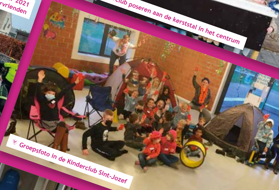
▽ Groepsfoto in de Kinderclub Sint-Jozef