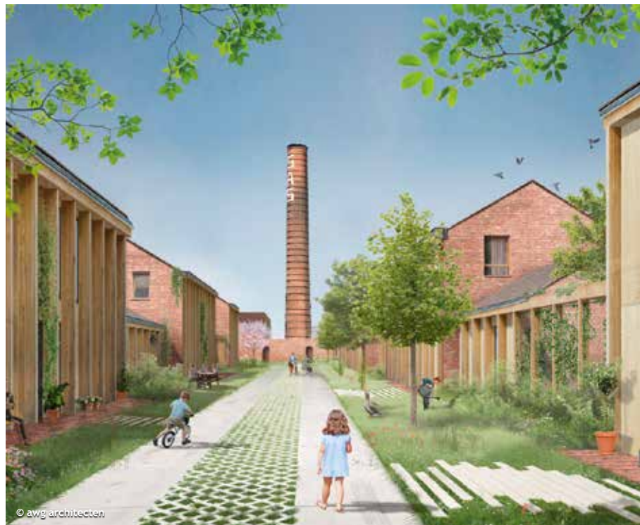
3. Zicht in een autoluwe straat tussen de bouwzones langsheen Hoge-Heideweg richting het ovenfragment met schouw.

Het industriële erfgoed en het bestaande dorps- en landschappelijke weefsel vormt het kader voor de herontwikkeling van de site Sas. Een nieuw plein verlengt de (zicht)as vanaf de Sint-Jozefkerk tot de middenzone van het Sas, verankert de site in de dorpskern van Sint-Jozef en vormt een schakelplek naar het nieuwe landschapspark. Autoluwe straten tussen de bouwzones zijn een voortzetting van deze parkstructuur en bieden perspectieven op het industrieel erfgoed in het hart van de site: het ovenfragment met de markante schoorsteen en de arcadebogen.