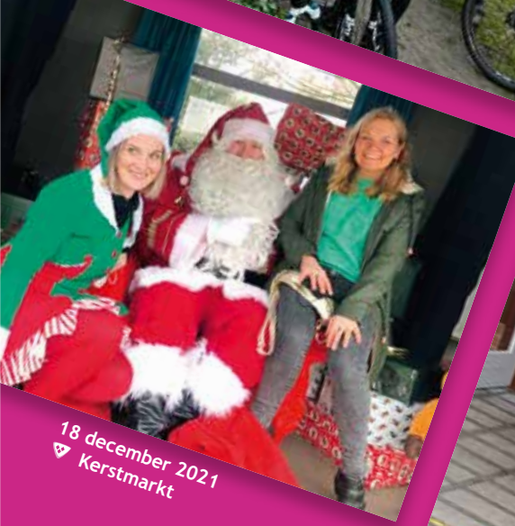
18 december 2021 ▽ Kerstmarkt