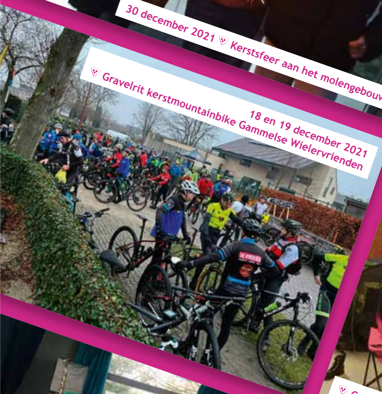
18 en 19 december 2021 ▽ Gravelrit kerstmountainbike Gammelse Wielervrienden