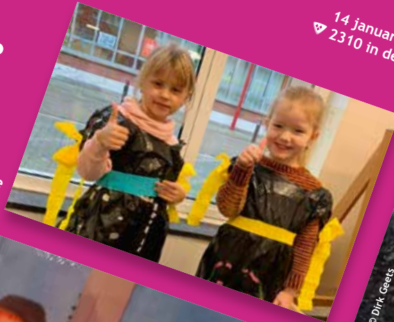
14 januari 2022 ▽ 2310 in de mist