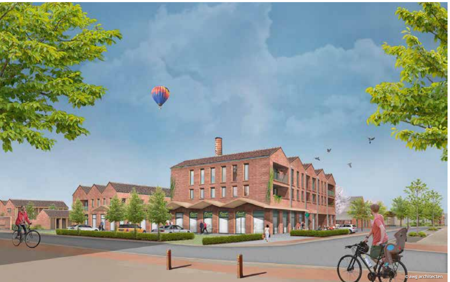
4. Zicht op de hoek van Stevennekens en de straat Sint-Jozef met ruimte voor commerciële functies, mogelijk in combinatie met een dagcentrum van Emmaüs vzw.

De omgevingsvergunning voor de woonzones wordt dit jaar aangevraagd, zodat de werken kunnen starten in 2023. Zo kunnen we de eerste bewoners verwelkomen in 2025.