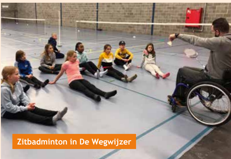
Zitbadminton in De Wegwijzer