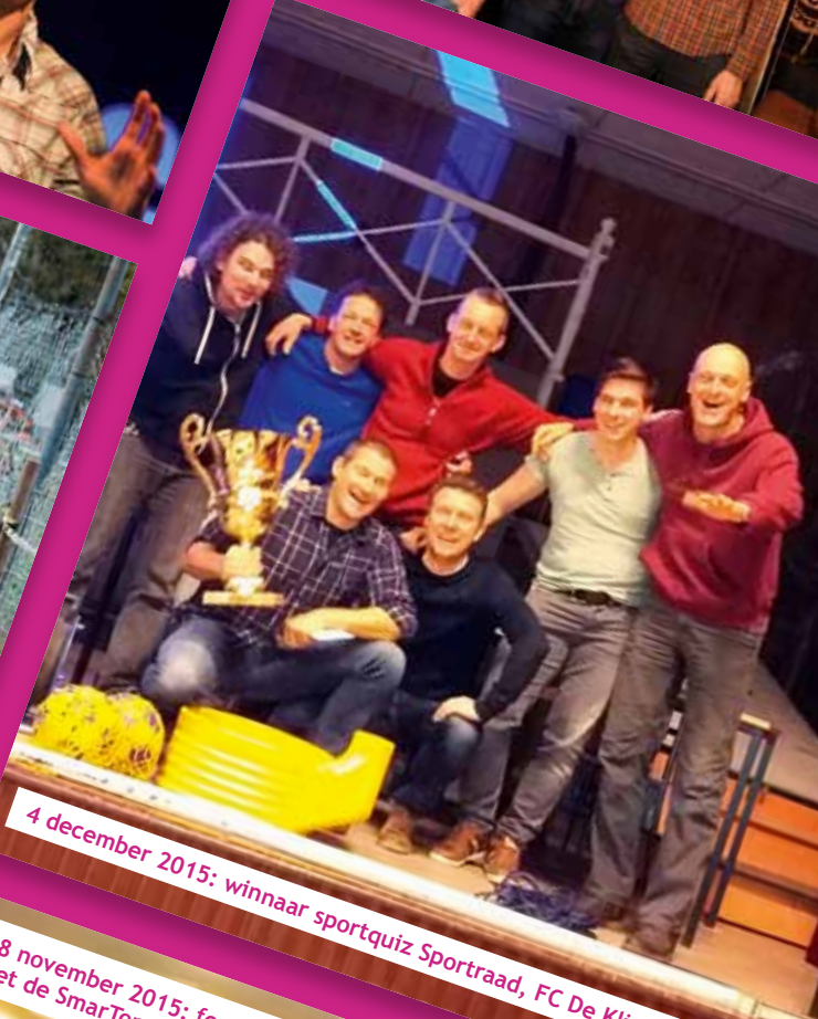
4 december 2015: winnaar sportquiz Sportraad, FC De Kliefhamers