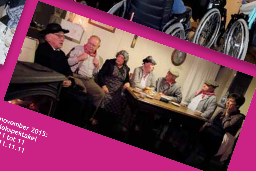
11 november 2015: Muziekspektakel van 11 tot 11 voor 11.11.11