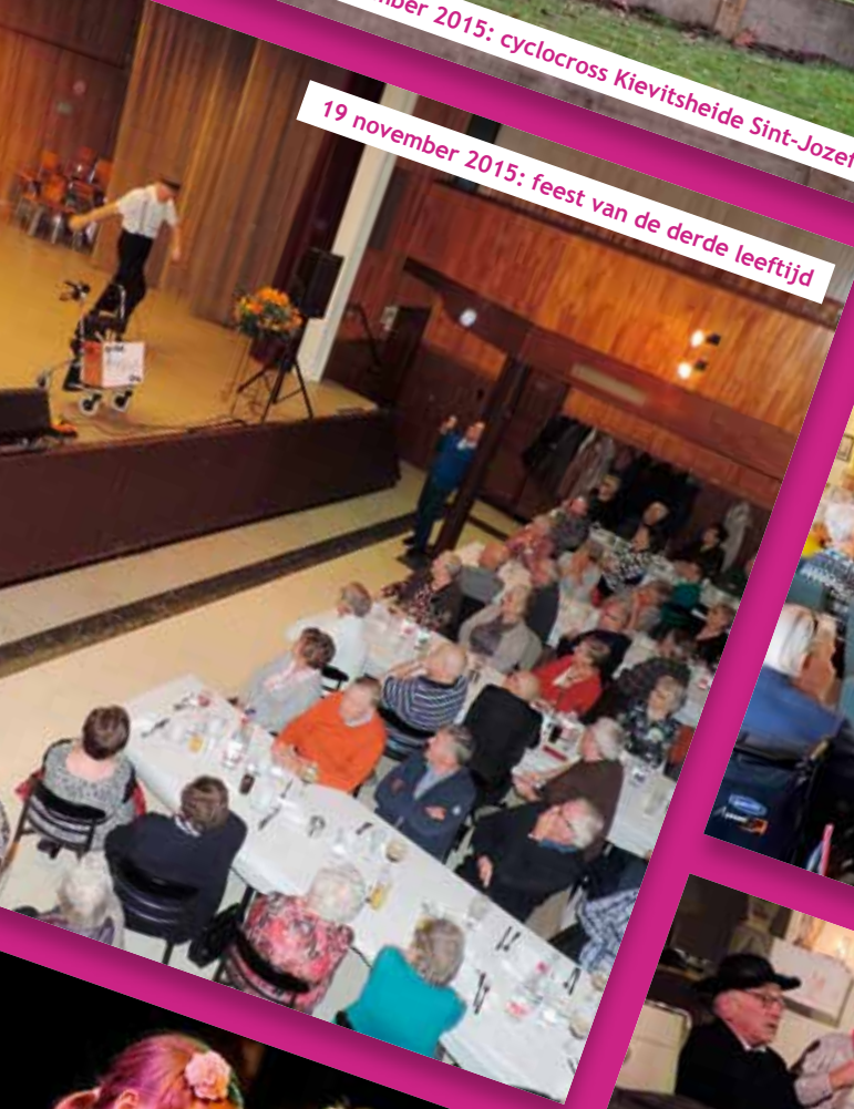
19 november 2015: feest van de derde leeftijd