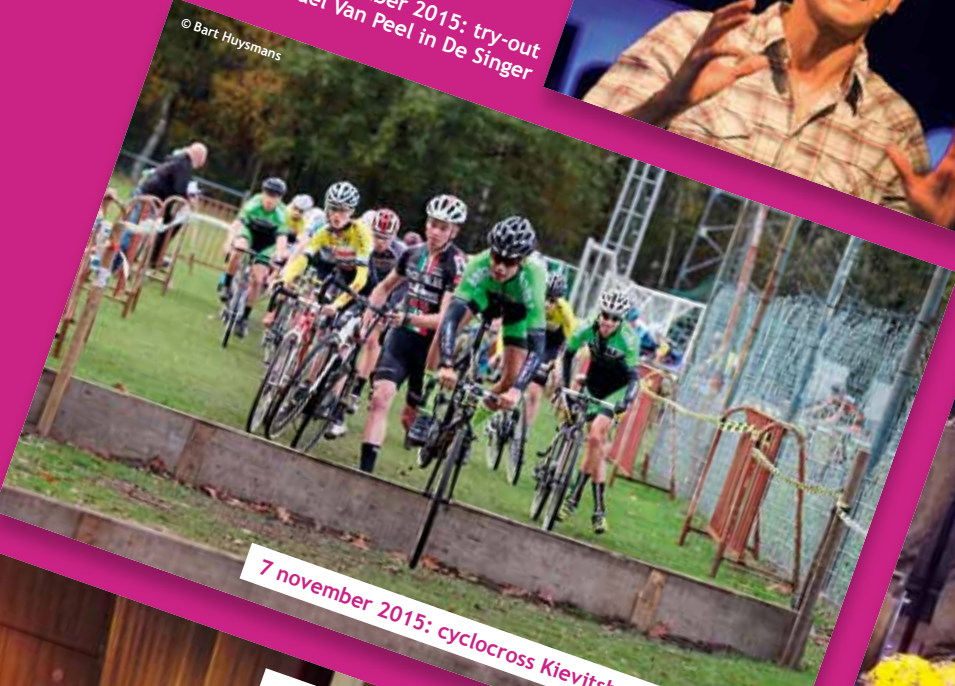
7 november 2015: cyclocross Kievitsheide Sint-Jozef